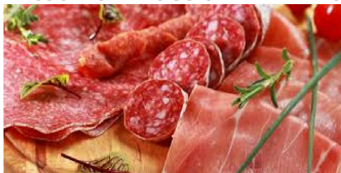
Antipasto con salumi mantovani