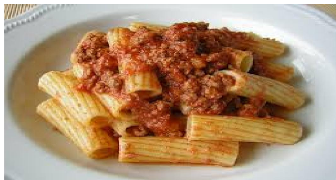
Risotto alla pilota e Maccheroni con stracotto