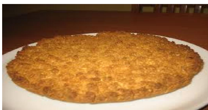
Arrosto di maiale con patate e verdure - Sbrisolona Acqua e vino della casa - Caffè e digestivo Segue musica autogestita e ballo